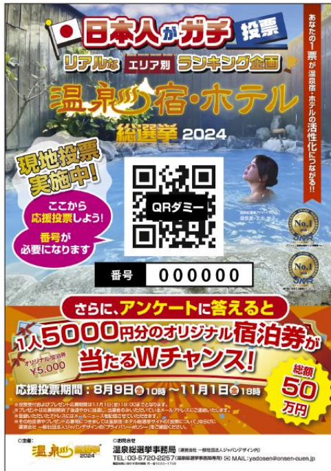
A型サイズポスター